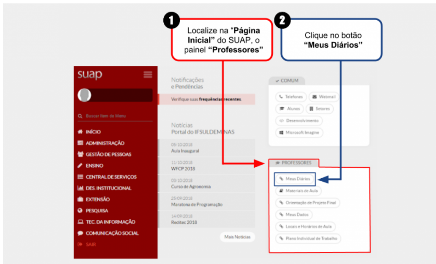
Figura 1: Acessar a tela "Meus Diários" por meio do atalho na Página Inicial do SUAP.

Após acessar a tela " Meus Diários " utilizando esse método, clique aqui para ir direto para o passo seguinte (Selecionar o Período letivo e Acessar Diário).