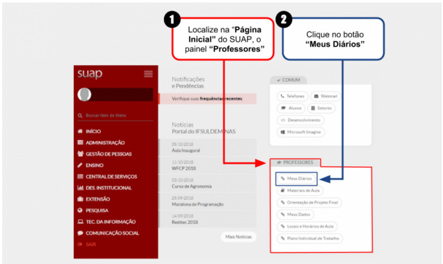
Figura 1: Acessar a tela "Meus Diários" por meio do atalho na Página Inicial do SUAP.

Após acessar a tela " Meus Diários " utilizando esse método, clique aqui para ir direto para o passo seguinte (Selecionar o Período letivo e Acessar Diário).