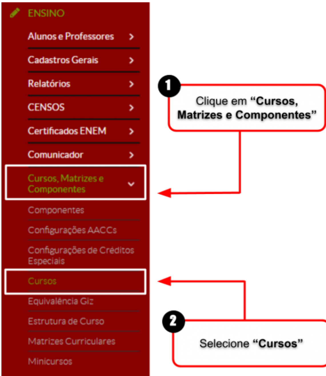
Figura 1: Acessar tela "Cursos".