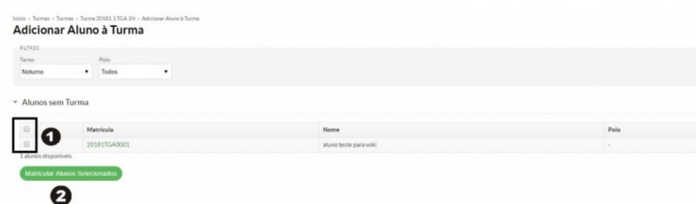
Figura 4: Escolher alunos que serão inseridos na turma.

Será aberta a tela "Adicionar Aluno à Turma" e nela, marque os "Alunos" que farão parte da turma e clique no botão "Matricular Alunos Selecionados" como ilustrado na Figura 4 .